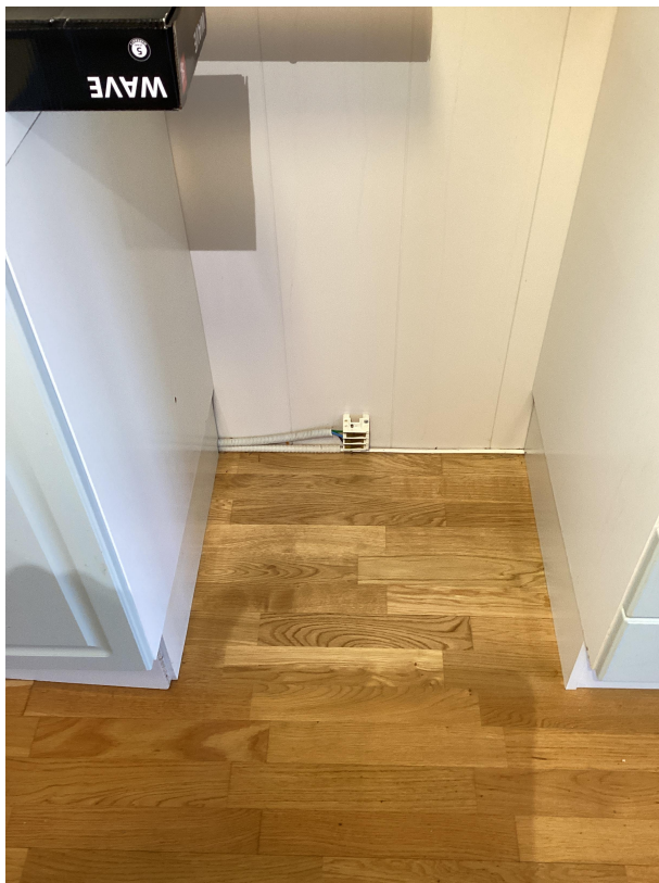
Skjema: "NELFO Per. kontr. Bolig NEK405-2: Boligkontroll 405-2" Spørsmål: Kommentar Filnavn: img_0001.jpg