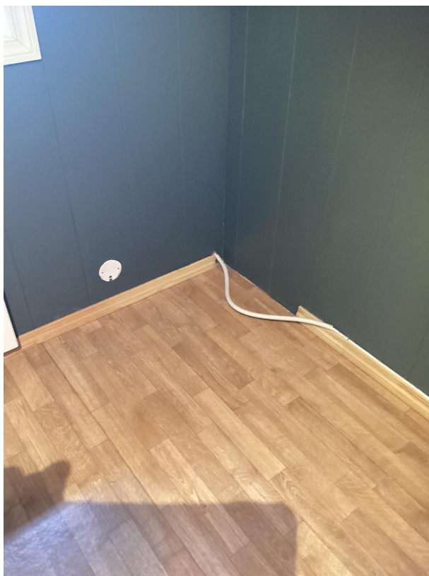
Skjema: "NELFO Per. kontr. Bolig NEK405-2: Boligkontroll 405-2" Spørsmål: Kommentar Beskrivelse: Løs kabel soverom, Filnavn: img_0001.jpg